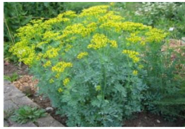
شکل ۱: شکل ظاهری گونه‌ی R. graveolens (rue) (۹)