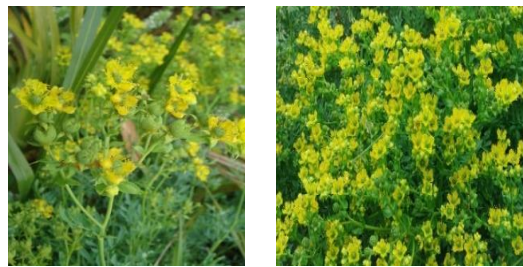
شکل ۲: شکل ظاهری گونه‌ی Ruta chalepensis